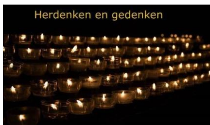
Herdenken en gedenken

Echt stil is het hier niet, en toch voelt het beladen. De woorden blijven hangen, als druppels aan een tak. Een beetje ongemakkelijk. Gelukkig is er koffie, thee, chocomelk. Dampende koppen, waar je je handen omheen kan vouwen. En als je even niets kan zeggen, kan je blazen. Verdriet maakt koud, - ook in de zomer en bij dertig graden - Het is gek hoe het gebeurt. Moeilijk aan te wijzen, voorzichtig bijna: de ruimte plooit zich om ons heen als een jas, een zachte deken, waar we allemaal onder kunnen. Aarzelend komen de tongen los, wie we missen, brengt ons samen. Het verdriet wordt er niet minder van en toch lijkt het, even, een beetje lichter om te dragen. We praten over wie hij was, nog steeds is, voor altijd blijven zal. De haan mag kraaien wat hij wil, wij zwijgen niet. We hebben hem zo graag gekend.